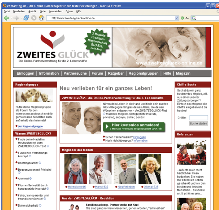
Abbildung: Screenshot Startseite Zweitesglueck-Online.de