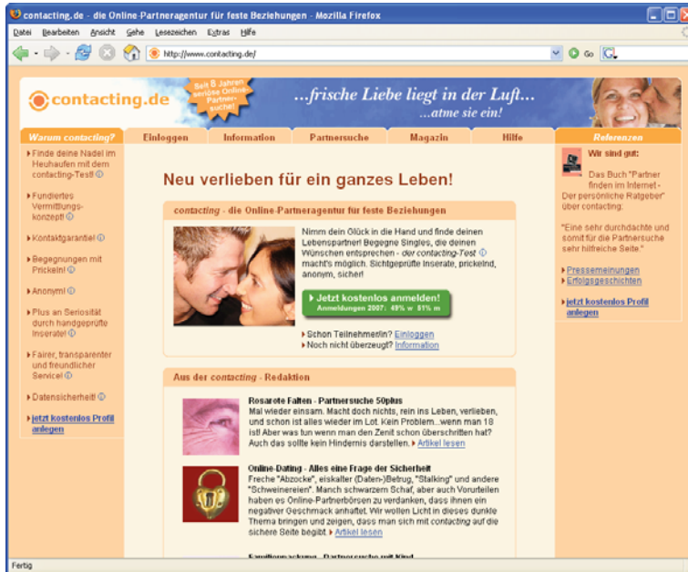
Abbildung: Screenshot Startseite contacting.de

contacting.de - die Online-Partneragentur für feste Beziehungen