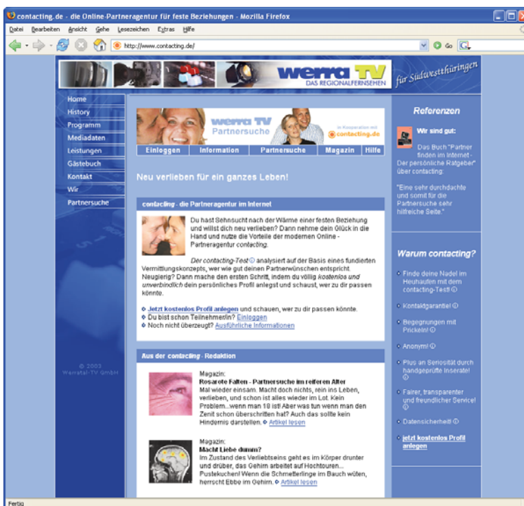
Abbildung: Screenshot Startseite Werra TV-Partnersuche

Zielgruppe: Partnersuchende aus D, AT, CH mit dem Wunsch nach einer festen Beziehung.