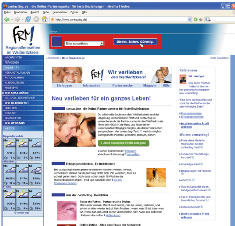
Abbildung: Screenshot Startseite FRM-Partnersuche