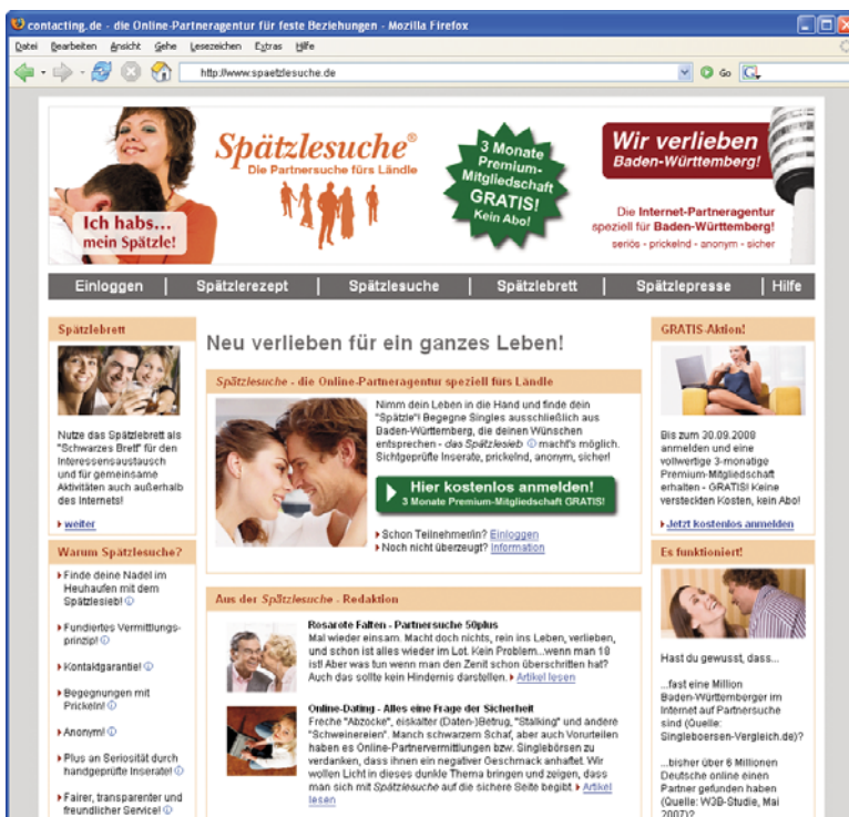
Abbildung: Screenshot Startseite Spätzlesuche.de

Zielgruppe: Partnersuchende ab 40 Jahren aus D, AT, CH mit dem Wunsch nach einer festen Beziehung.